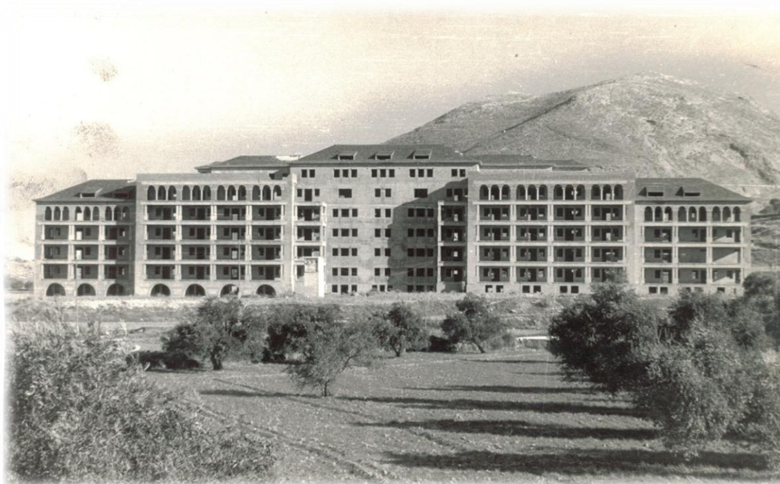
Diario Ideal, 28 de octubre de 1965

El siguiente paso se produjo el 19 de agosto de 1944, cuando el BOE 2 publica el anuncio de la “subasta de las obras de albañilería, estructuras, pocería y cantería del edificio destinado a Sanatorio Antituberculoso en Granada”. Una vez adjudicadas las obras comenzaron en mayo de 1945, al mismo tiempo que se prolongó hasta los terrenos del futuro sanatorio antituberculoso el camino que, saliendo de Granada, moría entonces en Cogollos Vega. Sobre el diseño del edificio hay que decir que fue obra del arquitecto madrileño Aurelio Botella Enríquez.